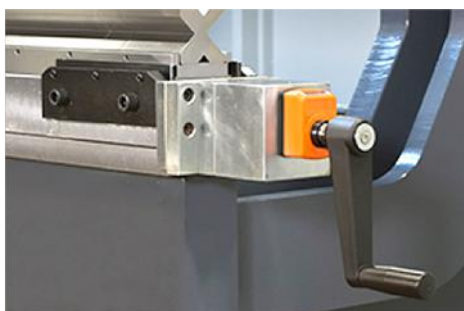
Tavola di compensazione manuale consigliabile per potenze superiori a 1000 kN disponibile solo in versione manuale